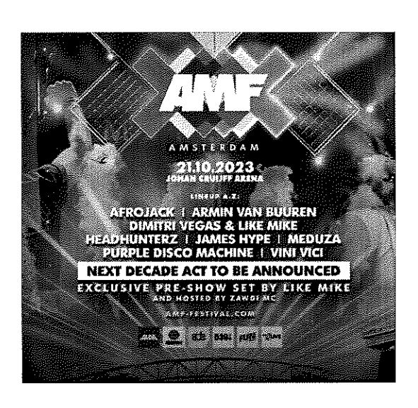
Experienta dubla Festival Amsterdam