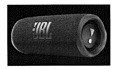
Boxa wireless JBL Flip 6